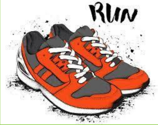
Daar zit ie!